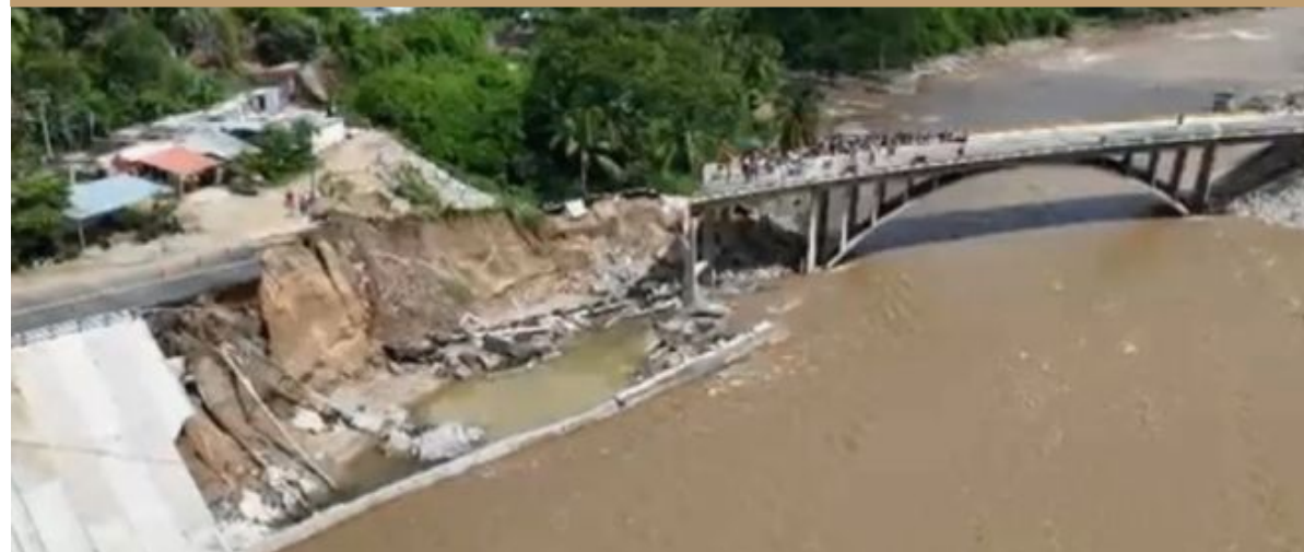
Carretera Chilpancingo Acapulco, Km 114+490