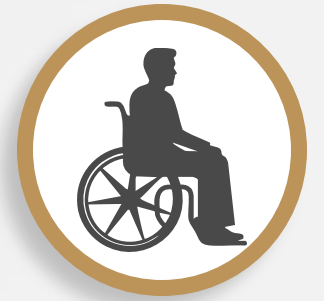
Personas con Discapacidad