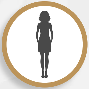
Mujeres Jefas de Familia