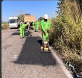
CONSERVACIÓN DE CARRETERAS