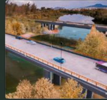
PUENTES Y DISTRIBUIDORES VIALES