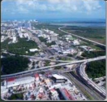
OBRAS DE CONTINUIDAD