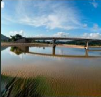
PROGRAMA CARRETERO DE GUERRERO