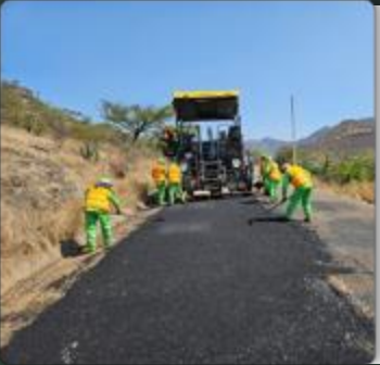
PROGRAMA LÁZARO CÁRDENAS DEL RÍO