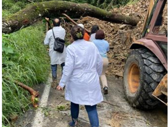
Ingreso de brigada médica IMSS Bienestar a San Bartolo Tutotepec, Hidalgo.