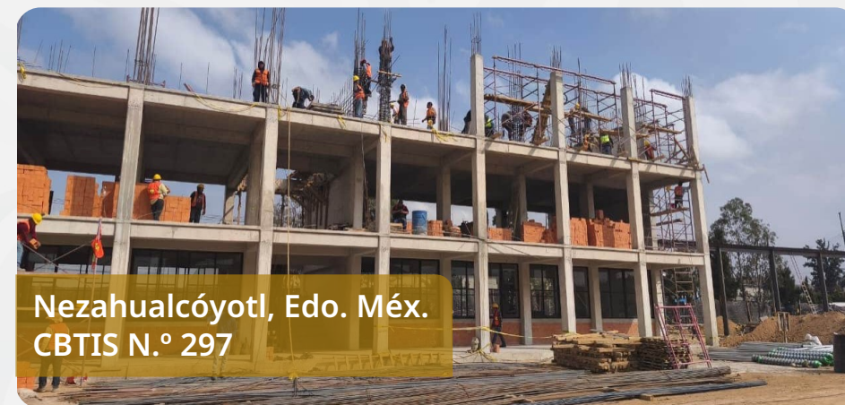
Nezahualcóyotl, Edo. Méx. CBTIS N.º 297