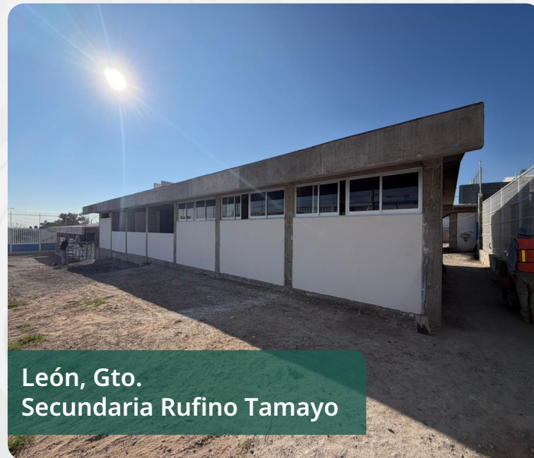
León, Gto. Secundaria Rufino Tamayo