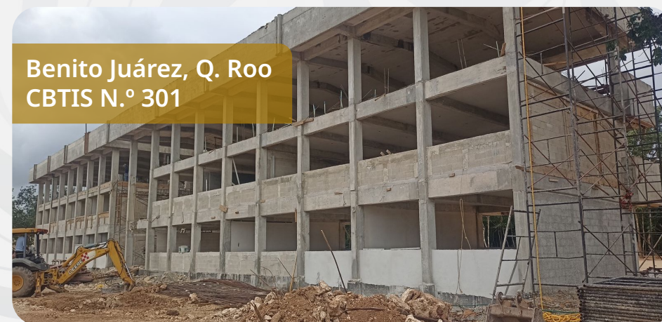
Benito Juárez, Q. Roo CBTIS N.º 301