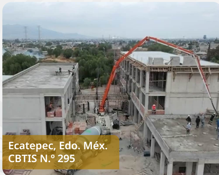
Ecatepec, Edo. Méx. CBTIS N.º 295