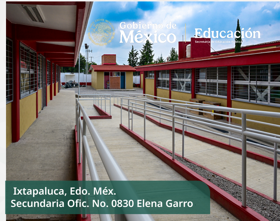
Ixtapaluca, Edo. Méx. Secundaria Ofic. No. 0830 Elena Garro