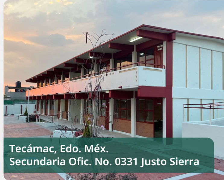
Tecamac, Edo. Méx. Secundaria Ofic. No. 0331 Justo Sierra