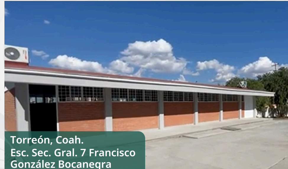
Torreón, Coah. Esc. Sec. Gral. 7 Francisco González Bocanegra