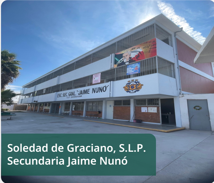
Soledad de Graciano, S.L.P. Secundaria Jaime Nunó