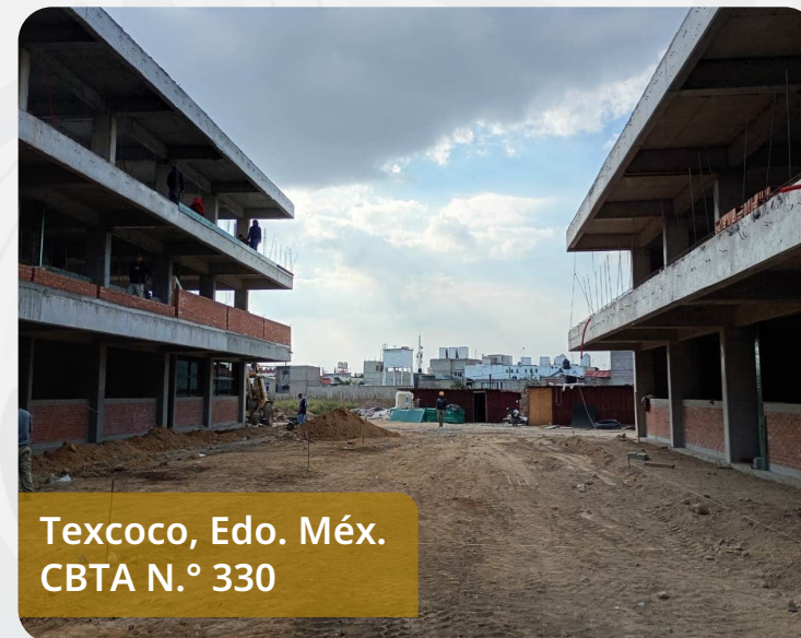
Texcoco, Edo. Méx. CBTA N.º 330