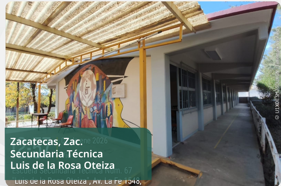
Zacatecas, Zac. Secundaria Técnica Luis de la Rosa Oteiza Escuela Secundaria Técnica Num. 67 "Luis de la Rosa Oteiza", Av. La Fe 1348,