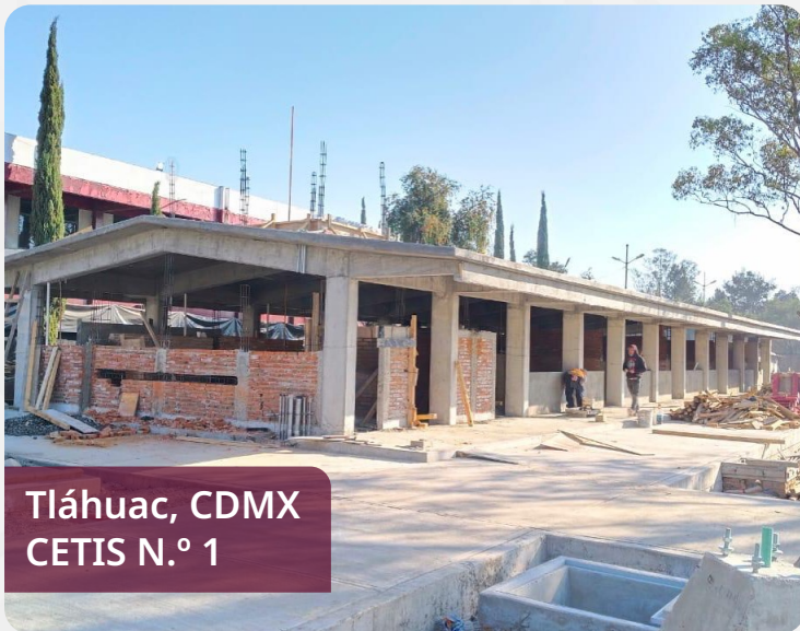
Tláhuac, CDMX CETIS N.º 1