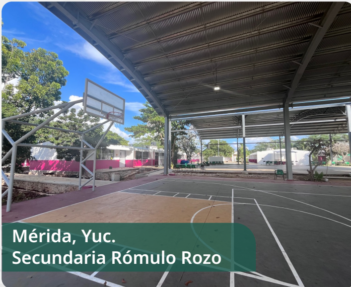
Mérida, Yuc. Secundaria Rómulo Rozo