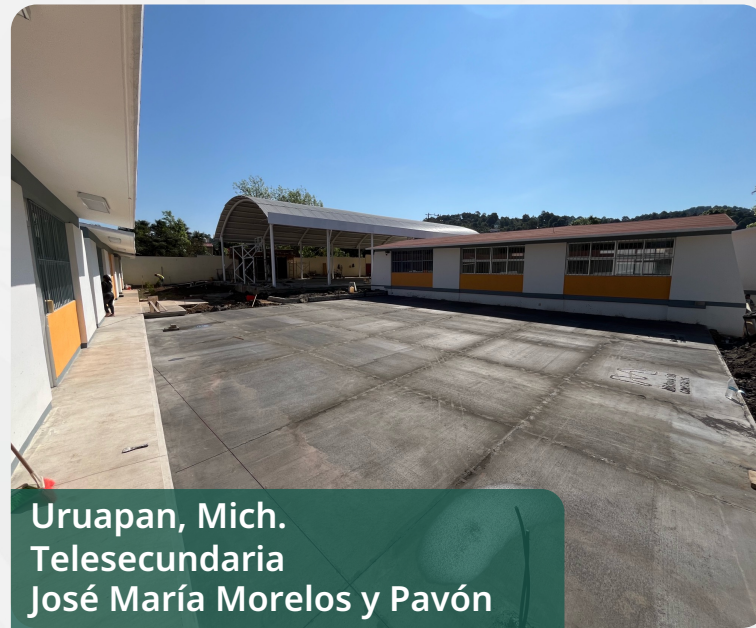
Uruapan, Mich. Telesecundaria José María Morelos y Pavón