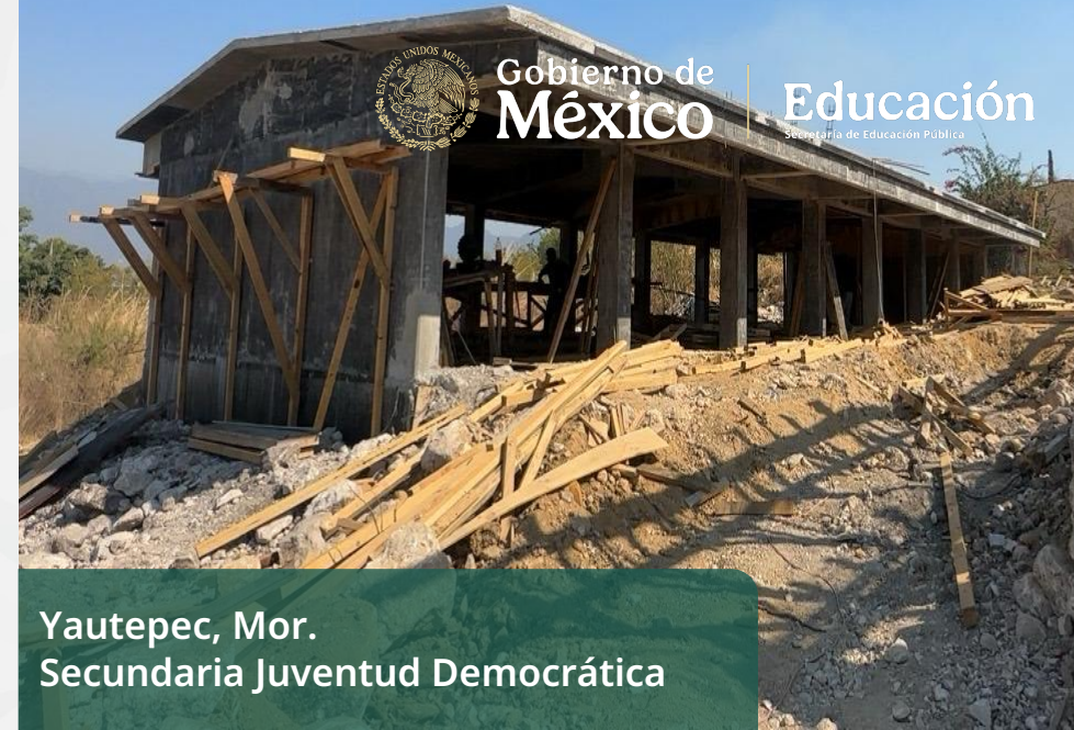
Yautepec, Mor. Secundaria Juventud Democrática