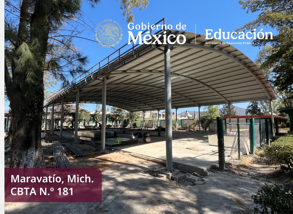
Maravatío, Mich. CBTA N.º 181