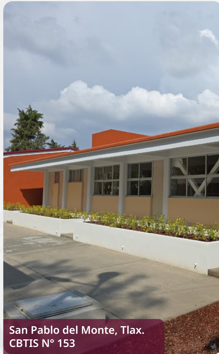
San Pablo del Monte, Tlax. CBTIS N.º 153