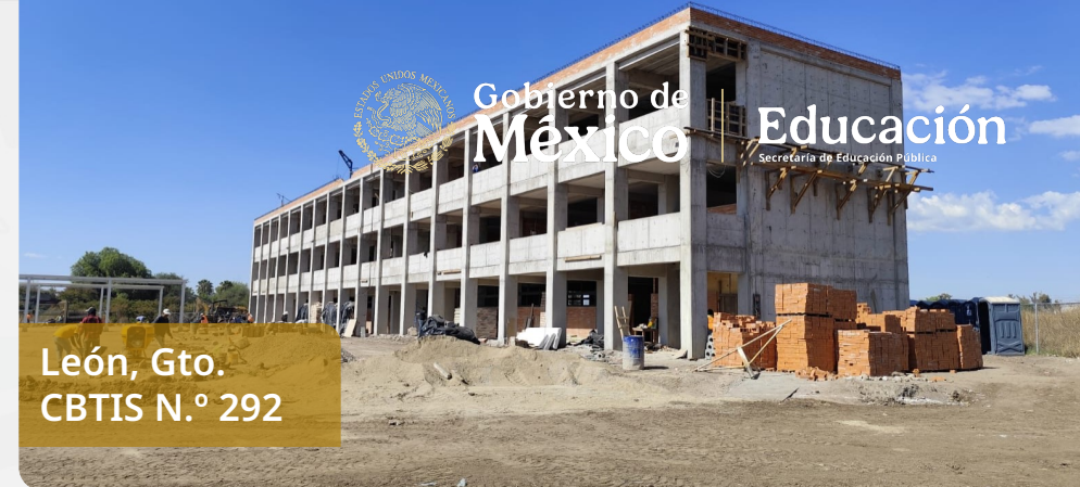
León, Gto. CBTIS N.º 292