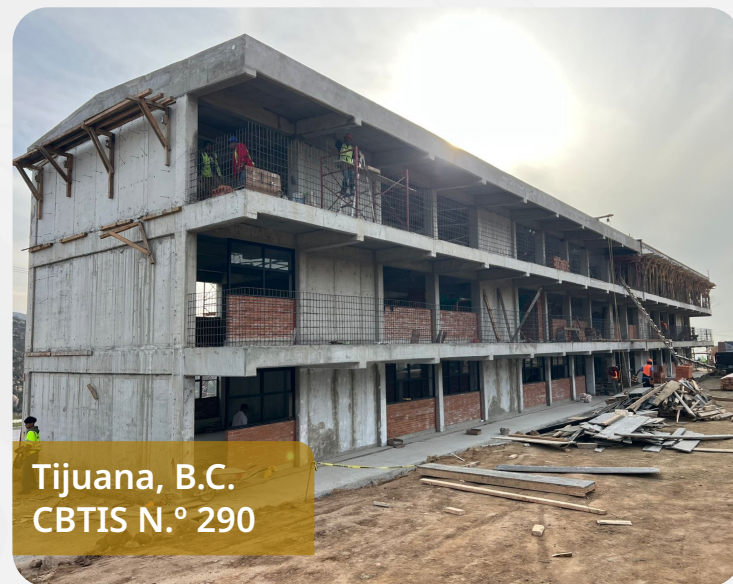
Tijuana, B.C. CBTIS N.º 290