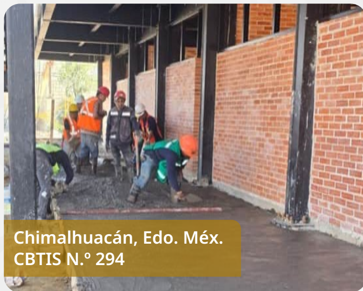
Chimalhuacán, Edo. Méx. CBTIS N.º 294