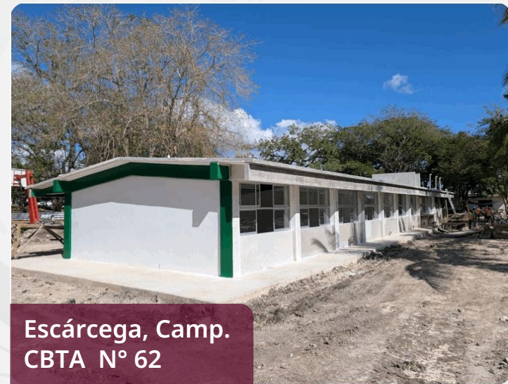
Escárcega, Camp. CBTA N.º 62