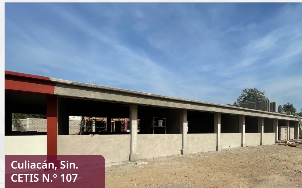
Culiacán, Sin. CETIS N.º 107