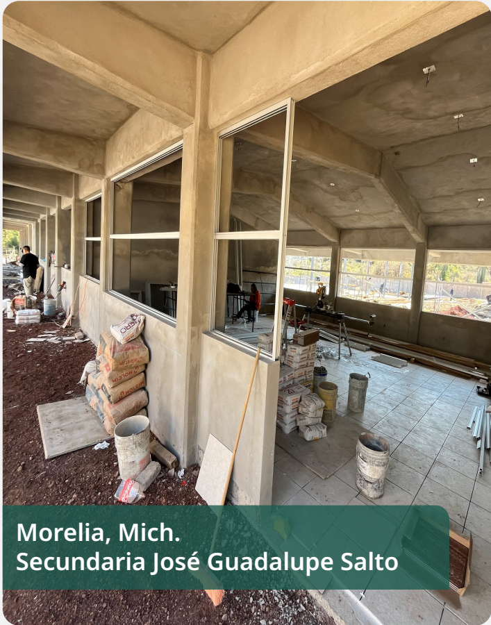
Morelia, Mich. Secundaria José Guadalupe Salto