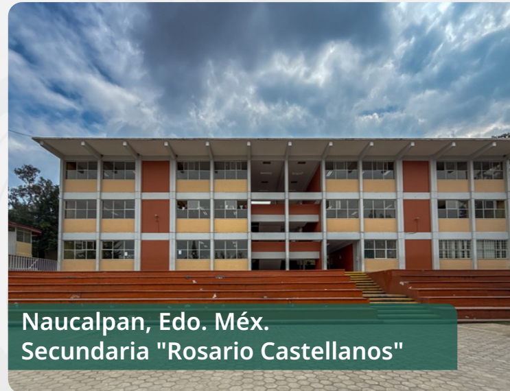
Naucalpan, Edo. Méx. Secundaria "Rosario Castellanos"