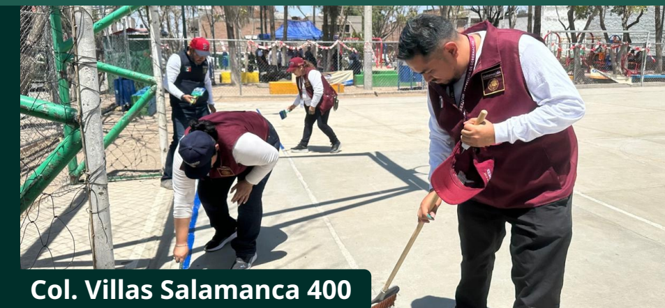
Col. Villas Salamanca 400