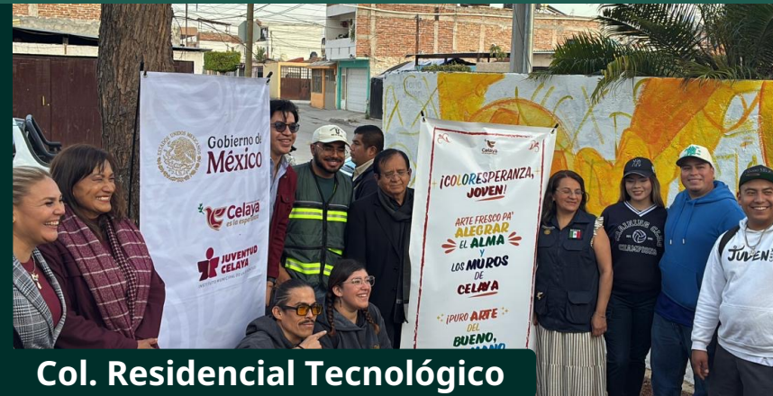
Col. Residencial Tecnológico