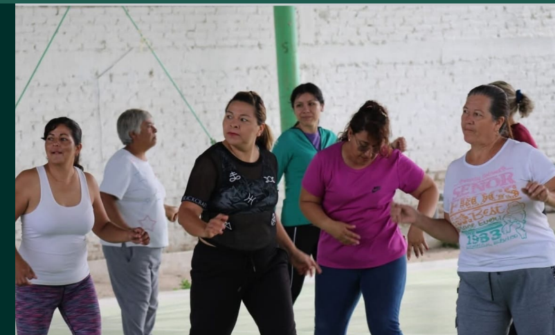
Feria deportiva, San Francisco del Rincón