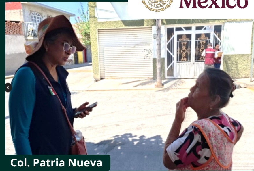
Col. Patria Nueva