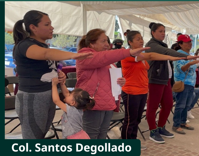
Col. Santos Degollado