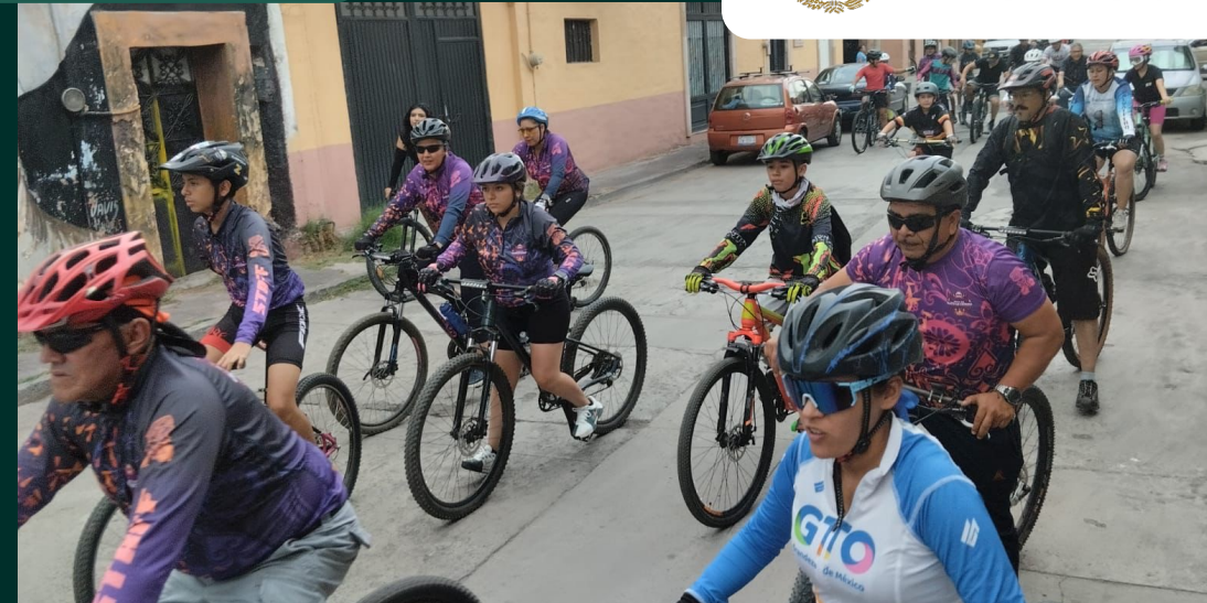
Rodada ciclista, Salvatierra