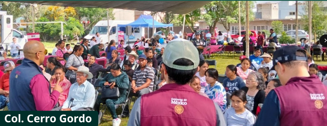
Col. Cerro Gordo