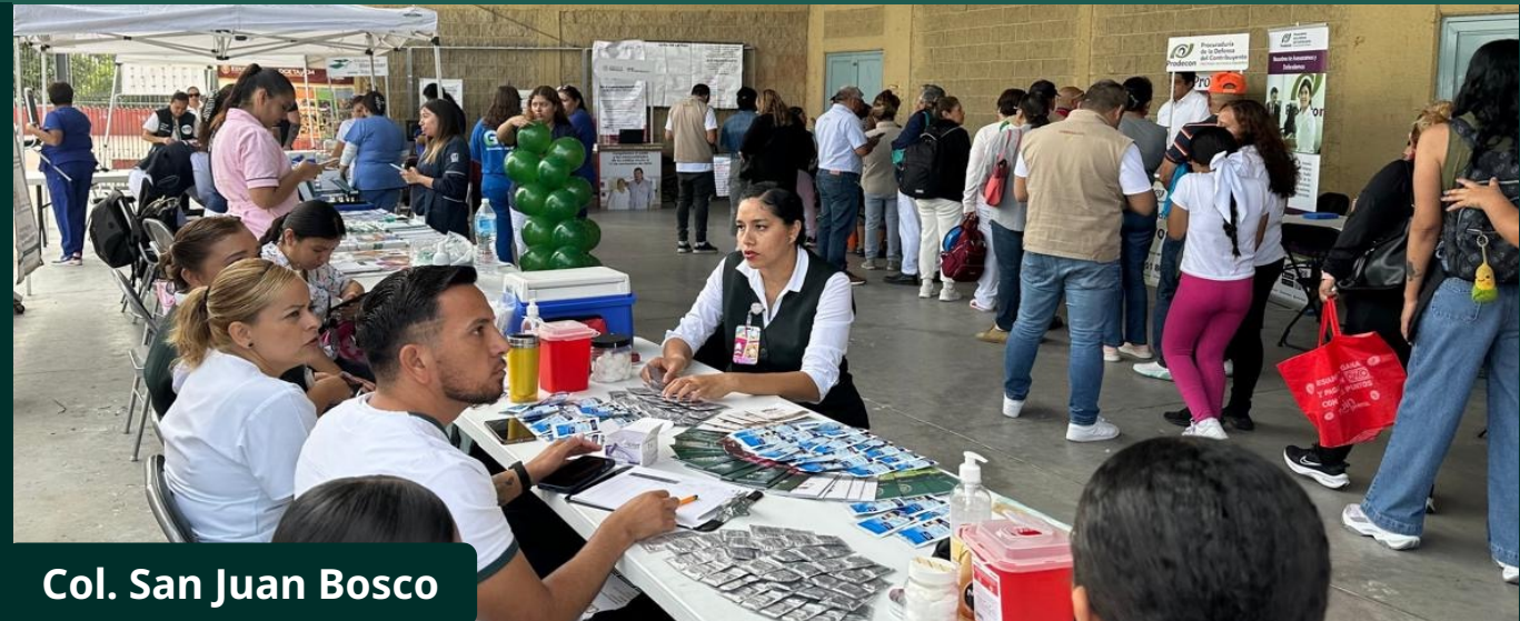
Col. San Juan Bosco