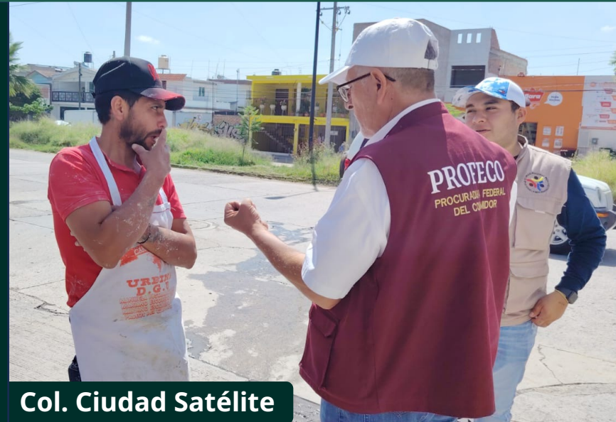
Col. Ciudad Satélite