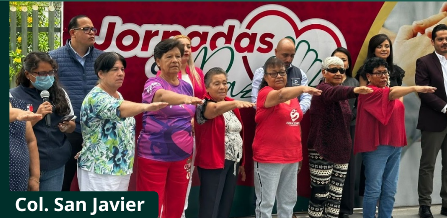
Col. San Javier