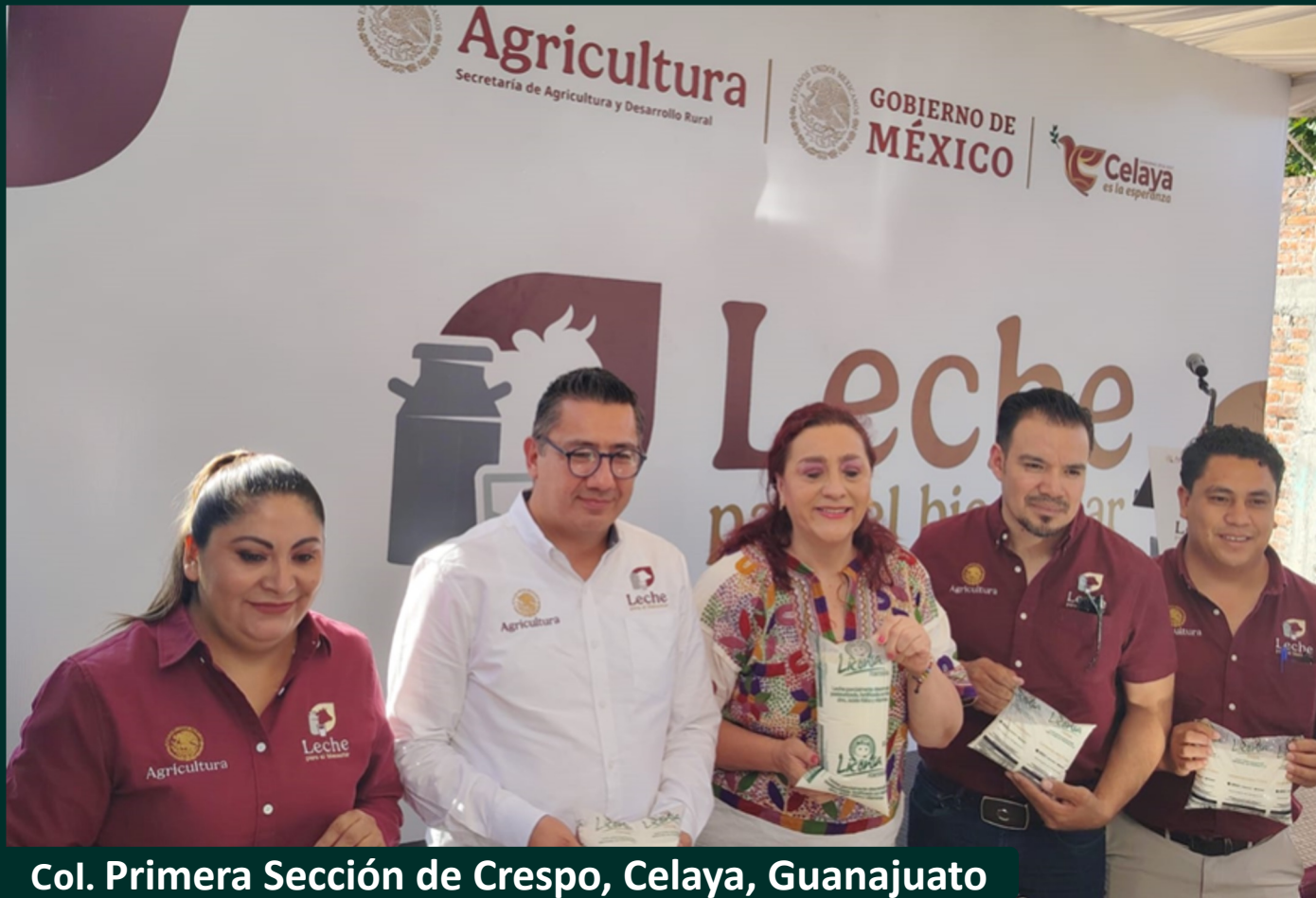
Col. Primera Sección de Crespo, Celaya, Guanajuato