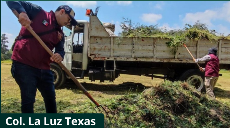
Col. La Luz Texas