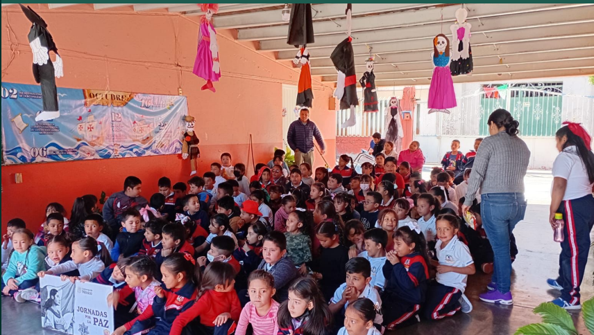
Exhibición de tradiciones y leyendas, Silao