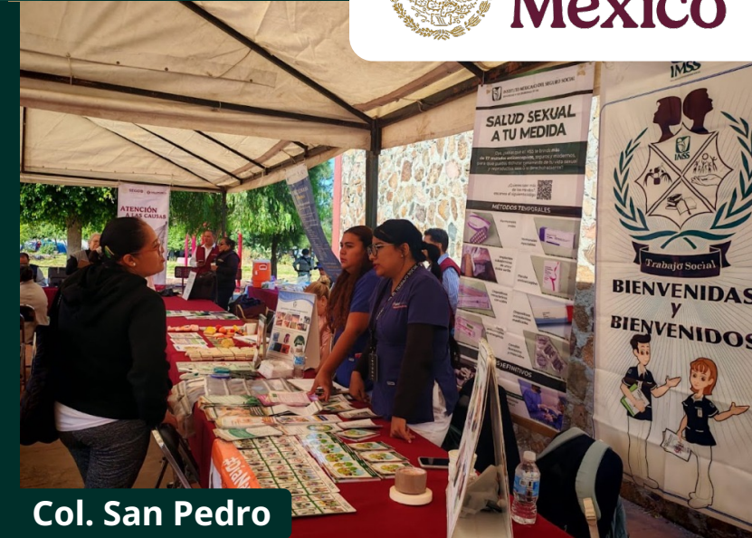
Col. San Pedro