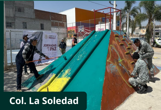
Col. La Soledad