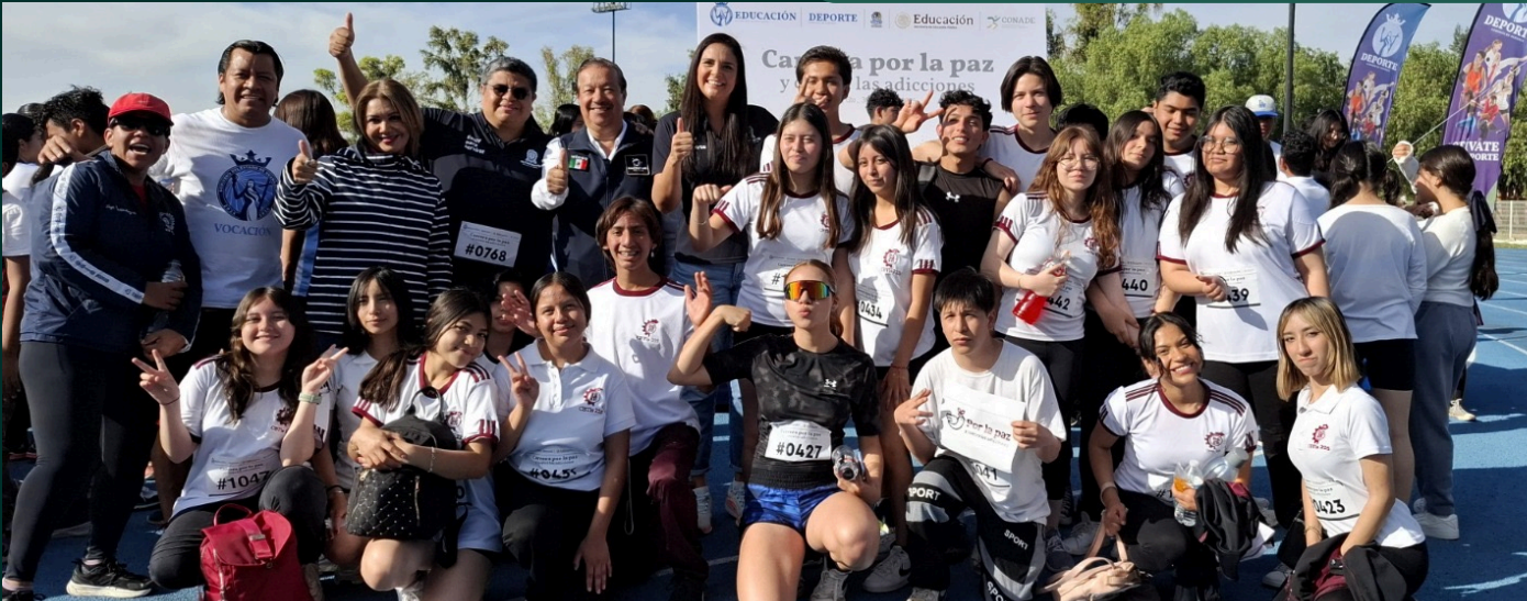
Feria deportiva, Guanajuato