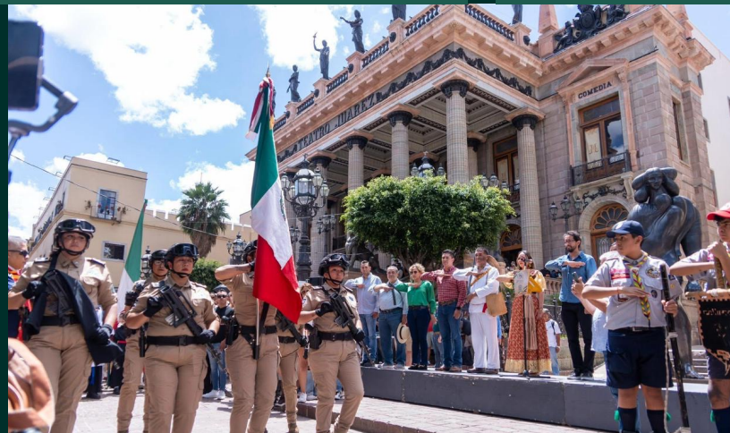
Acto cívico, Guanajuato