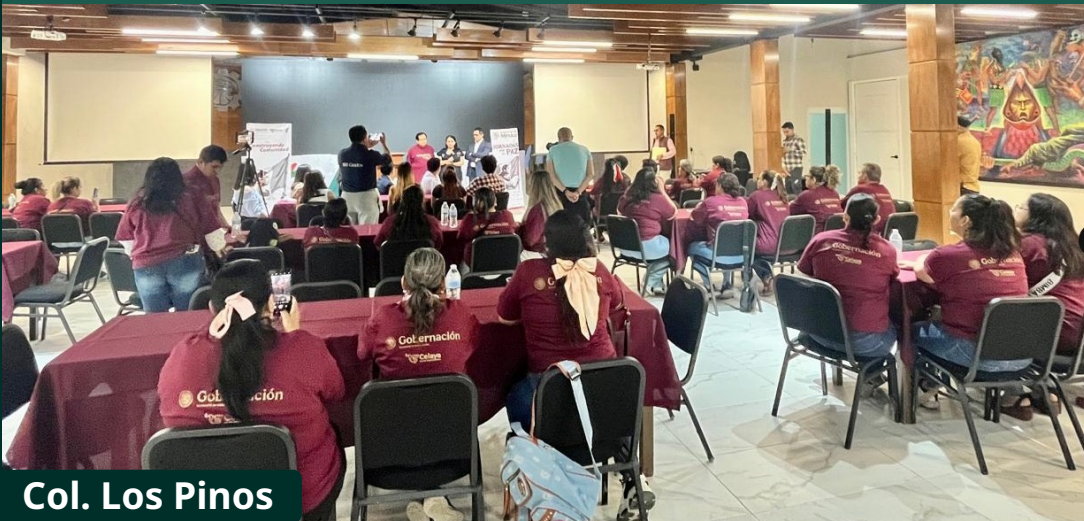
Col. Los Pinos