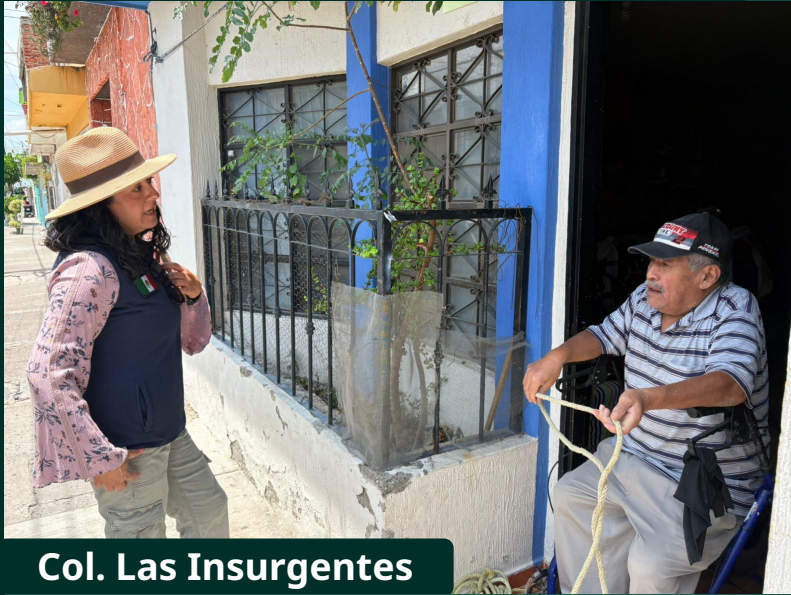
Col. Las Insurgentes