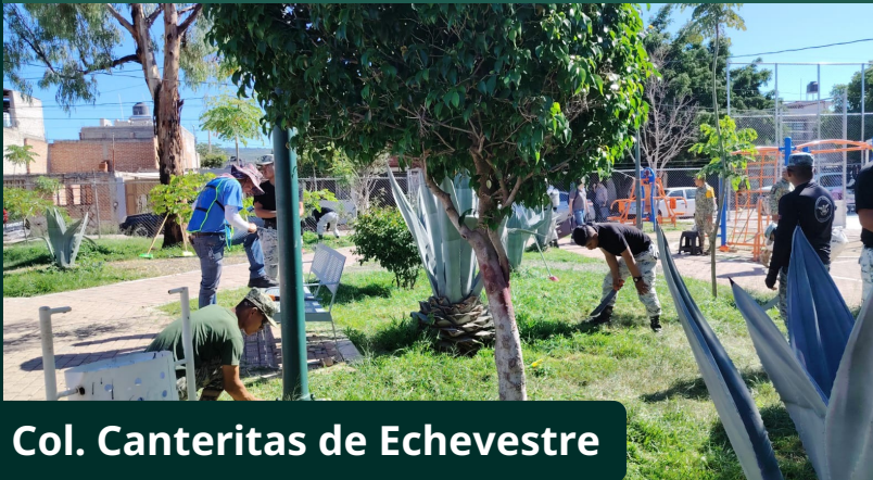
Col. Canteritas de Echevestre