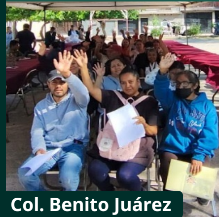
Col. Benito Juárez